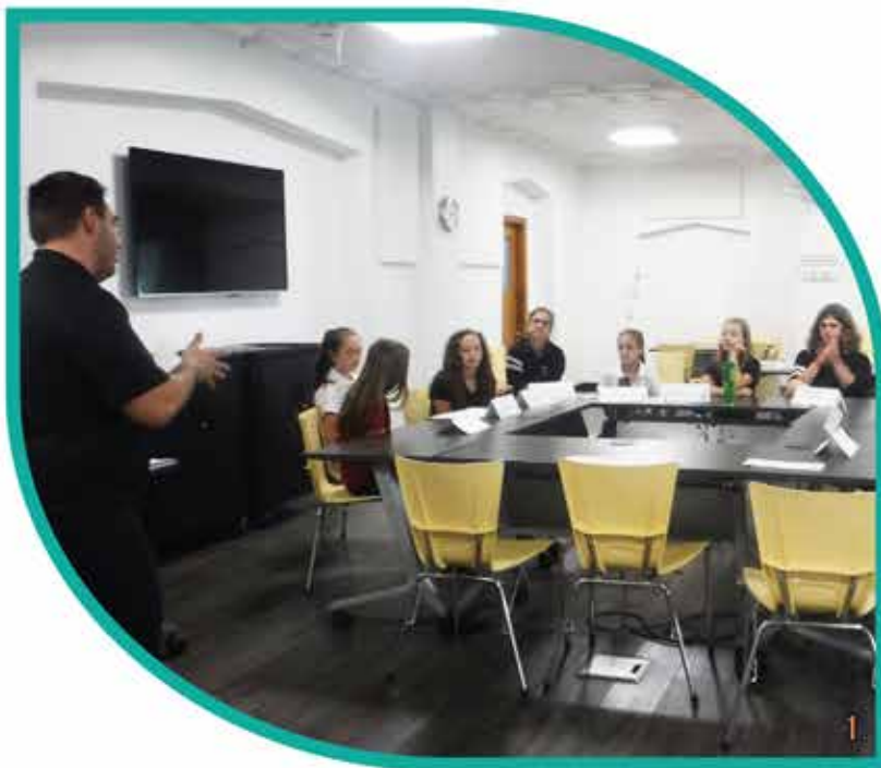
Ateliers de consultation avec des élèves du Collège Esther-Blondin.

En guise de suivi, des bilans environnementaux annuels devront être produits pour ainsi peser les pour et les contres de la Politique, bref en connaître les réelles répercussions.