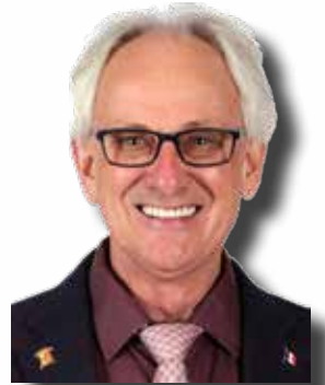
Pierre Lasalle Maire de Saint-Jacques